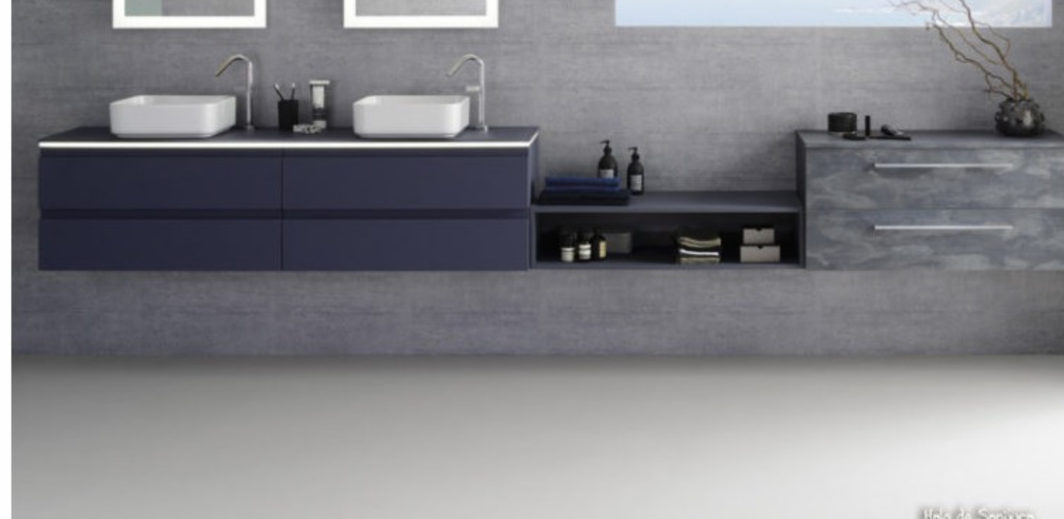
Meuble de salle de bain Halo, galaxy soft laqué, Sanjura

La salle de bain de style bord de mer est souvent de style rustique. Elle évoque la patine des climats marins qui rongent le bois et font craquer les peintures. Pour moderniser, la solution est d'opter pour des meubles de salle de bain aux lignes contemporaines comme la gamme Lumen de la marque Sanjura. La laque bleu menthol ou algue marine viendra contraster les matériaux bruts comme des murs en pierre ou en béton ciré.