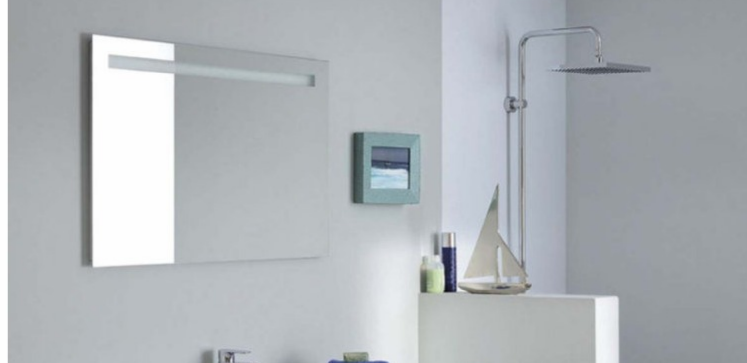
Hôtel Agrandil à Mykonos

Le mieux c'est évidemment d'être « authentique », un petit tableau chiné dans une brocante, un souvenir de voyage, des coquillages ramassés consciencieusement au cours des été... Et on mélange avec quelques pièces design et artisanales.