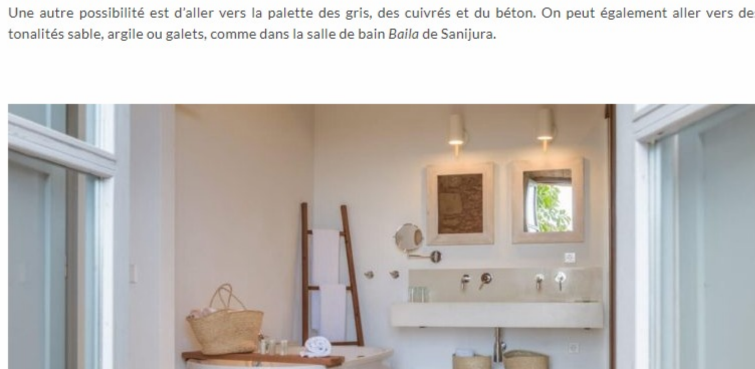
Meuble de salle de bain Sobro, champagne, Sanjura

Tout comme le style campagne, le style bord de mer évoque la nature, la simplicité et l'artisanat. Dans un esprit maison de pêcheur, vous pouvez accessoriser votre salle de bain avec des matériaux naturels, tels que le bois brut ou flotté, le lin, la jute ou l'osier.