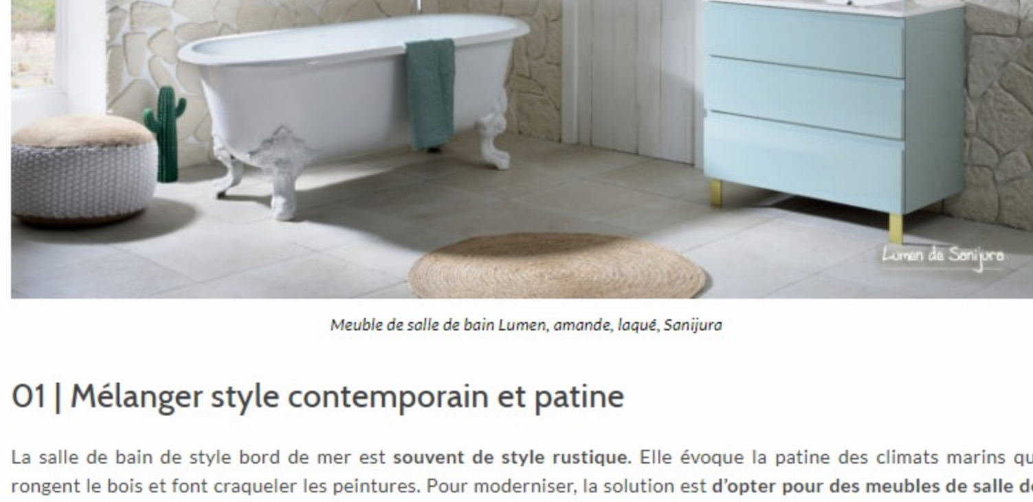
Meuble de salle de bain Lumen, amandé, laqué, Sanjura

[ Image en une : Vaseque Fontana sur plateau chêne du Québec - Sanjura ]