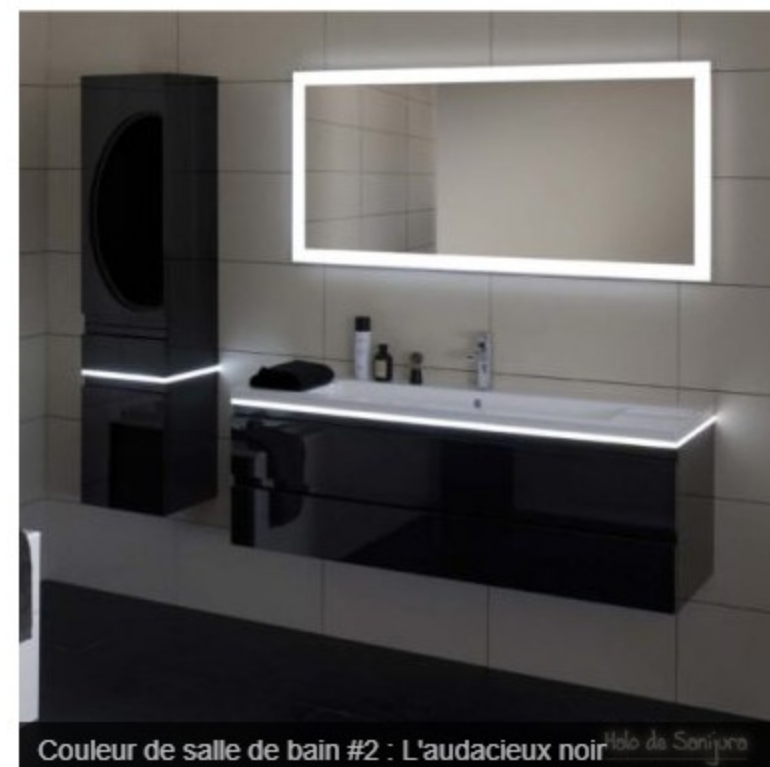
Couleur de salle de bain #2 : L'audacieux noir

Le noir fait partie des couleurs de salle de bain inattendues. Cette pièce généralement plus petite que les pièces de vie se prête pourtant à un total look noir.