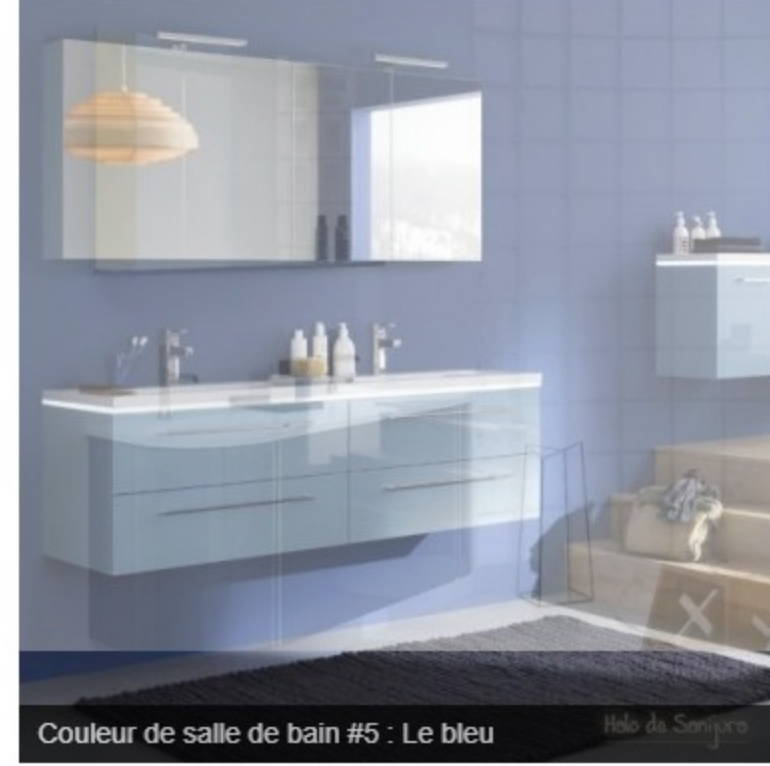
Couleur de salle de bain #5 : Le bleu

Le bleu est couleur la plus vue et sans doute la mieux adaptée aux salles de bain.