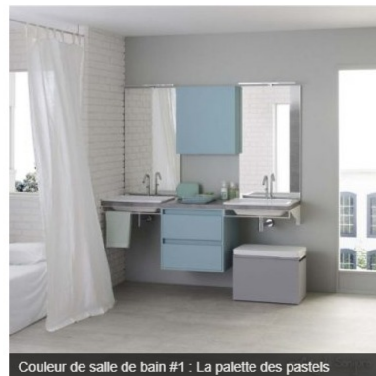
Couleur de salle de bain #1 : La palette des pastels

Votre salle de bain aussi colorée qu'une sérigraphie de Warhol ? Peut-être pas, mais vous avez tout de même envie de couleurs.