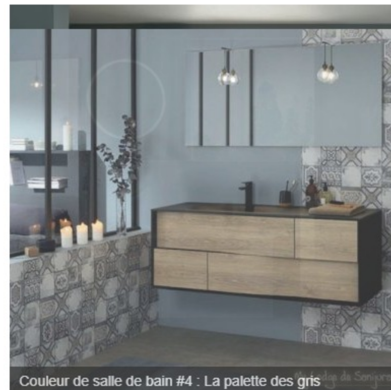
Couleur de salle de bain #4 : La palette des gris

Les couleurs de salle de bain minérales conviennent comme décor à une pièce zen. elles mettent en valeur les touches végétales et autorisent les pointes de couleurs vives. Les meubles en bois seront sublimés dans une toile de fond grise.