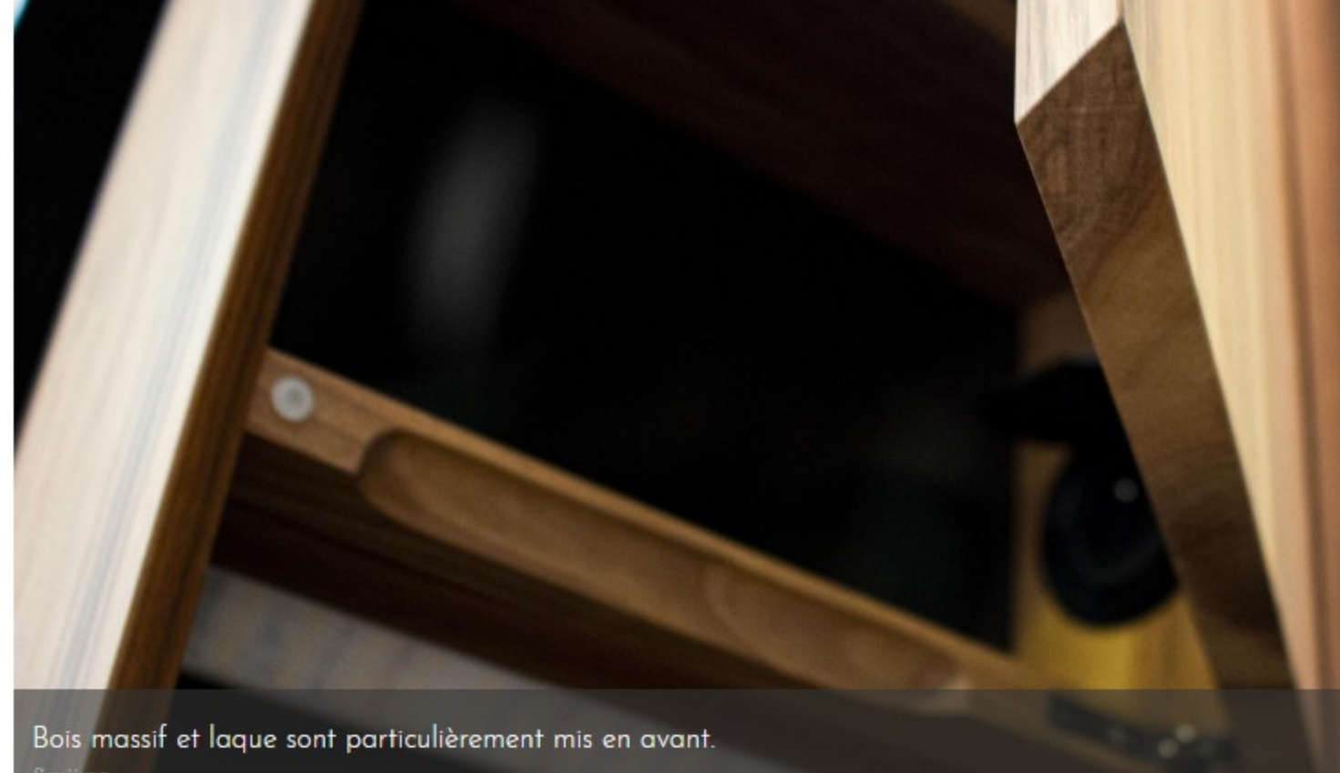
Bois massif et laque sont particulièrement mis en avant.