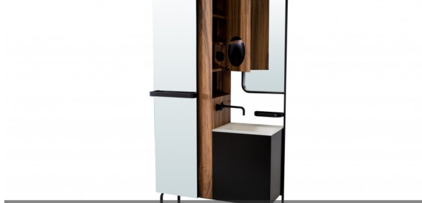
Tiny, un meuble de salle de bains qui réunit toutes les fonctions essentielles dans un volume minimum.