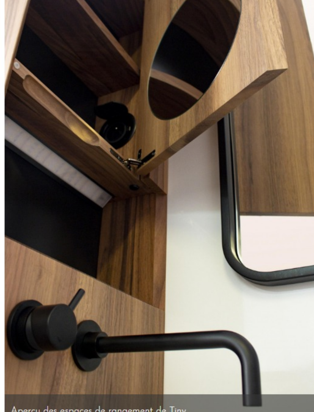
Aperçu des espaces de rangement de Tiny.

> Exposition Incubateur French Design 2019 - Galerie le French Design by VIA, 120, avenue Ledru-Rollin, 75011 Paris.